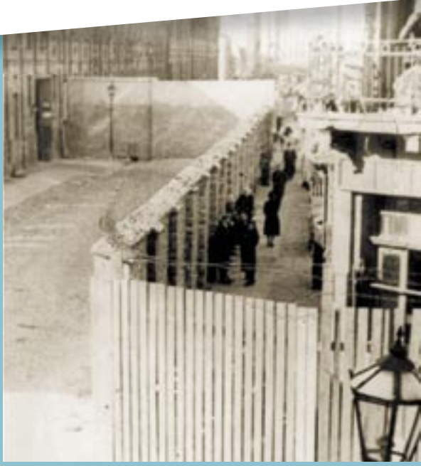
חומת גטו ורשה, פולין

למדתי כאן להעריך דברים פשוטים. כאשר עשינו אותם בהיותנו עדיין חופשיים, לא היה בהם כל ייחוד. למשל נסיעה באוטובוס או בחשמלית; הליכה לאורך הרחובות אל הנהר; ליקוק גלידה [...] דברים כה פשוטים ועכשיו מונעים אותם מאתנו. שרלוט ורסובה, בת 14, צ'כוסלובקיה