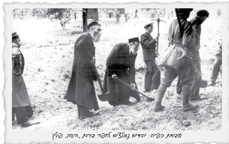
שזוגת כפייה: יהודים נאלצים לחפור זווה, ורשה, פולין