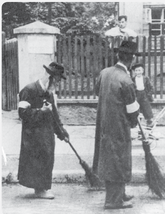
יהודים מצבוצ'א כפייה, קרקוב, פולין

כיצד הגיבו היהודים להיסלמות הפלאומים של ארצותיהם מחייהם?