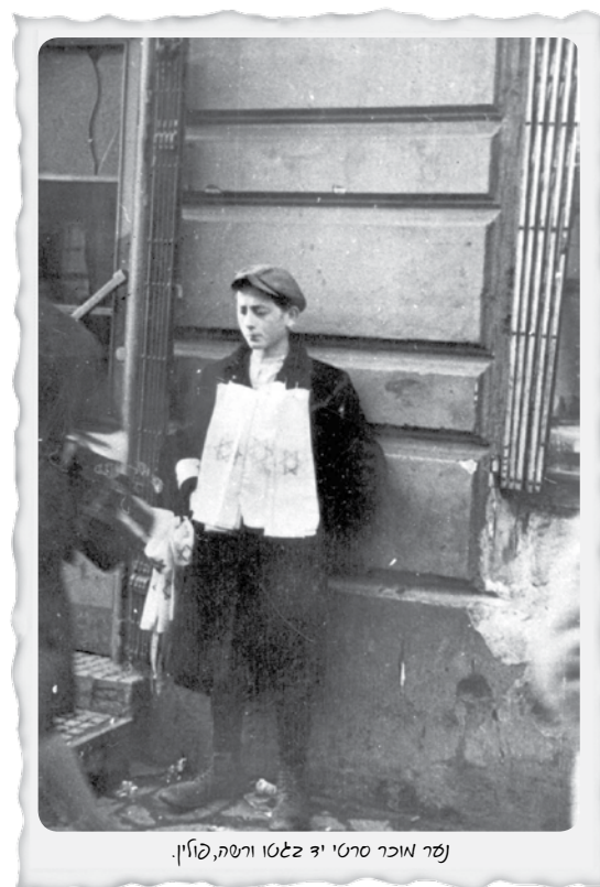
נשר אוכר סרטי יד זאטו ורשה, פולין.