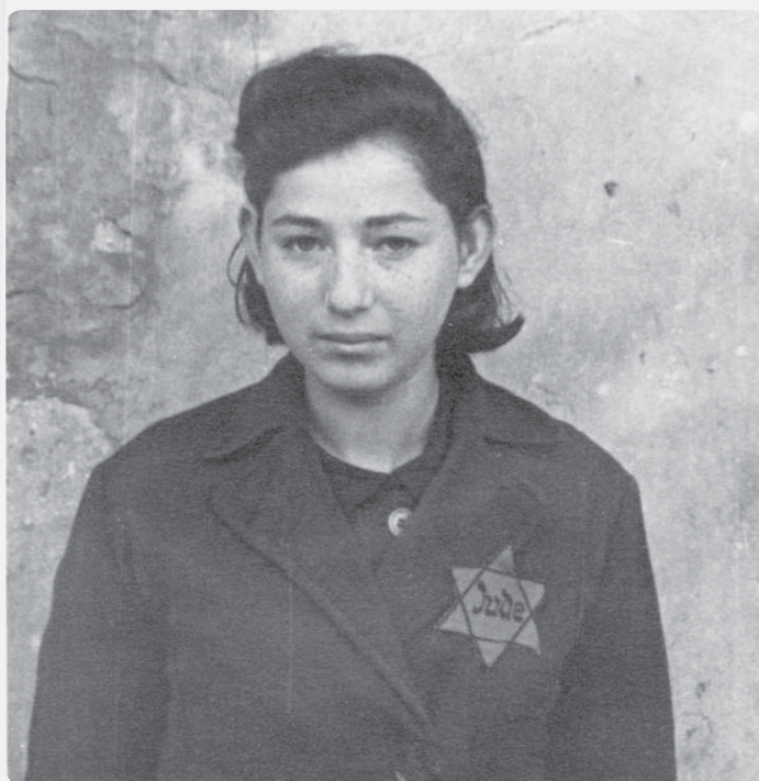
נשרה יהוש'יה ממסכתת פאצ'ר, טטי'זין, פאזין

יצחק רודשבסקי, יומנו של נער מוויילנה , תל אביב תשכ"ט, עמ' 16-17