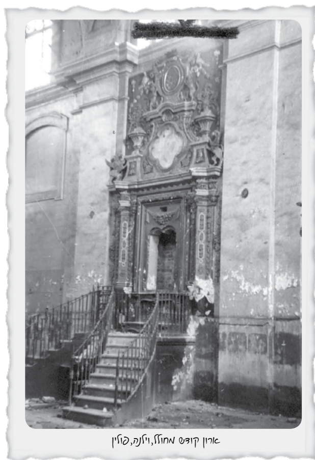
ארון קודש מחוזל, וילנה, פולין

מדוע אדעתכם הוטל על היזים אהצ'י אמ סכרי הערה? מהן המחשבות המתוארות על ידי היזים? מדוע אלו זהם דווקא מחשבות אלו? מדוע אדעתכם מסרו אמ נפשם אומם נסרים למסן הצלל סכרי הערה, קסולה שסאלה הייתה אסכן אומם אמ הקהילה כולה?