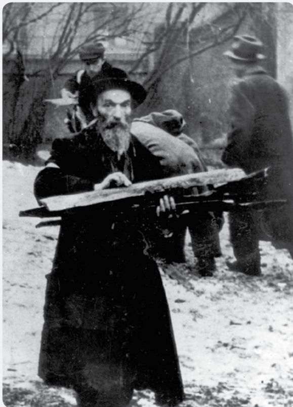
עבודת כפייה ז'טו, קרקוב, פולין