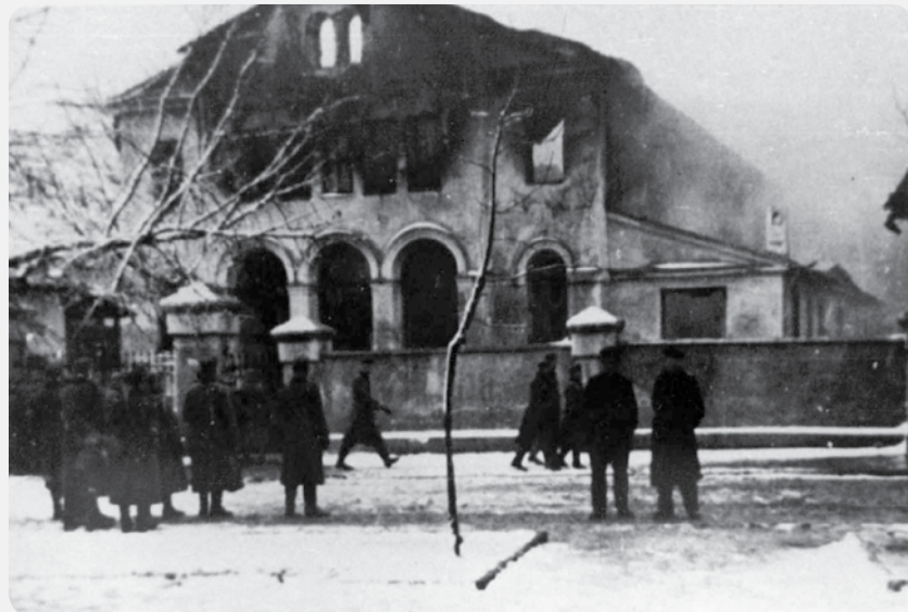
בית כנסת סוזה זאהוב, שיז'ובה, פולין, א"ש (1939)

מדוע מרגיש בן אברהם כי "עמנו נשאר חסר מגן"?