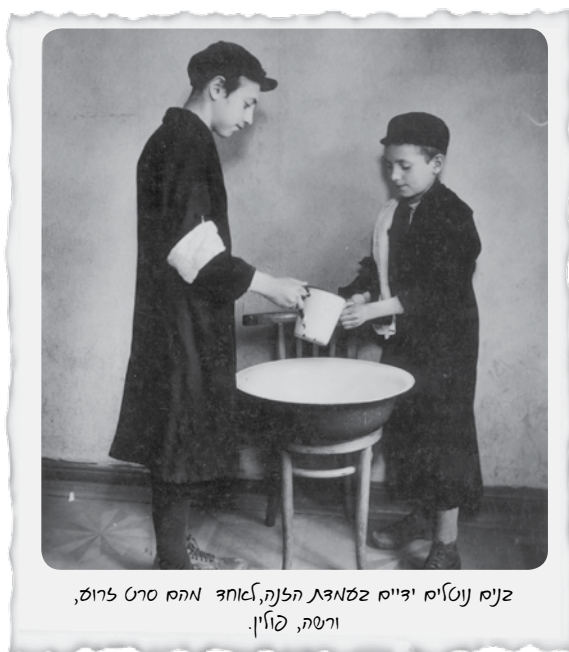
זנים נוספים ידיום זמנאג הלנה, לאחד מהם סרט לרוס, ורשה, פולין.

בכל מקום התפרסם הצו המחייב את נשיאת אות הקלון בזמן אחר, וגם צורת אות הקלון הייתה שונה ממקום למקום. לעתים היה זה מגן דוד צהוב ("הטלאי הצהוב"), ולעתים סרט לבן עם מגן דוד כחול. כמו כן גיל חובת סימון אות הקלון היה שונה ממקום למקום, והיו מקומות שבהם אף ילדים צעירים ביותר היו מחויבים בענידתו.