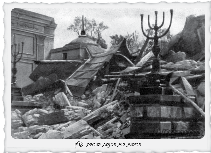
הריסות בית הכנסת בזוורשה, פולין

ימים מעטים לאחר פעולת הצלת ספרי התורה נהרס בית הכנסת על ידי הנאצים.