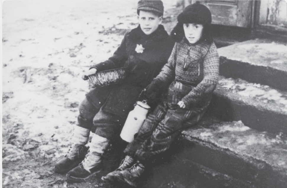
ילדים זרחוב זגטו קוזנא, איטלי

פעילות זו יכולה להוות סיכום לשיעור זה, או לכל שלושת מערכי השיעור.