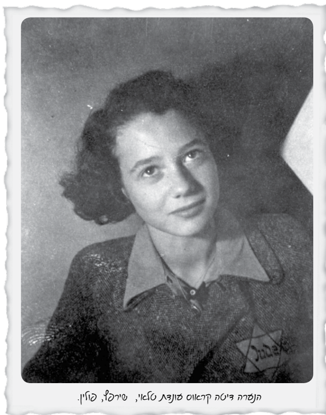
הנשרה דיטה קראוס סונצט טלאי, טירקל, פולין.