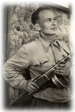
המשורר קצ'רגינסקי במדי פרטיזן

השיר הוא התמודדות רגשית של המשורר עם האבדן הטרגי של אשתו. קצ'רגינסקי בחר לשים את הדברים בשיר דווקא בפי הרעיה. ריחוק אמנותי זה הוא אמצעי לעיסוק בנושא הכואב כל כך באופן ישיר ומכאיב מעט פחות. גם אצל יוצרים אחרים, כשהמילים היום-יומיות והשיח הפשוט לא יכלו להביע את עצמת הכאב והקושי או את משאת הלב, הייתה היצירה לכלי משמעותי ולעיתים אף לדרך היחידה להביע את תחושותיהם ולהקל במעט את משא הנפש. השיר הולחן בקצב הטנגו ובוצע לראשונה בתאטרון של וילנה בהצגה "די יאגעניש אין פאס" (המהומה בחבית), והפך פופולרי בגטו. השיר הופץ אחר כך גם במחנות הריכוז, וכן הושר לאחר המלחמה. את הפופולריות של השיר האישי הזה אפשר להסביר בעובדה שהשכול והאבדן היו מנת חלקם של כלל תושבי הגטו. דווקא השיר האישי, סיפור של איש יחיד, נגע בכל אחד ואחד, ביטא את הרגשות שבדרך אחרת לא היה אפשר לבטא והיה למקור תמיכה. מעניין שקצ'רגינסקי בוחר לקרוא לשיר המתאר כאב וגעגועים בעקבות האבדן האישי בשם "אביב" - בחירה שאינה ברורה מאליה ומעמידה את המוקד בניתוח השיר על הניגוד הפנימי המתקיים בו בין הכרה באבדן לבין תקווה שאינה פוסקת להתקיים (לפחות לכאורה).