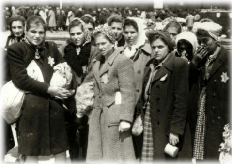
נשים שנמצאו כשירות לעבודה על הרציף לאחר הסלקציה, אושוויץ, מאי 1944