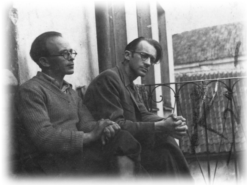
המשוררים סוצקבר וקצ'רגינסקי

שיעור זה עוסק בשירה שנוצרה בתקופת השואה. דרך ניתוח של כמה שירים נבקש לעמוד על תכניה השונים, על משמעויותיה ועל ההשפעות שהיו לה על בני התקופה. היכן ניכר בה השבר, ובמה היא מהווה המשכיות? האם רק בעצם התקיימותה, או שניתן למצוא גם בתכניה היבטים של העולם הישן?