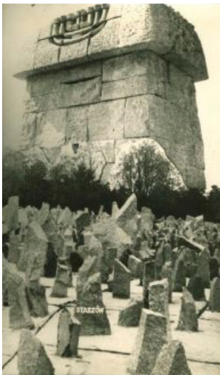
אתר ההנצחה בטקבנילקה

קינות הן סוגה שירית דתית כמו פיוט או סליחה, והן היו הדרך המסורתית להתמודד עם אבלו של היחיד ושל הכלל. הן שולבו בתפילה, וכך נהפך האירוע המתואר בקינה לחלק מהזיכרון של האומה כולה. במקרא יש קינות שונות; החשובה שבהן היא מגילת איכה, הקינה על חורבן בית המקדש הראשון שנכתבה בידי ירמיהו הנביא. קינות רבות חוברו בעקבות חורבן הבית השני, והן נכנסו אט-אט לסדר התפילה של יום האבל על חורבן הבית – תשעה באב. הקינות הושפעו ברובן מהסגנון של מגילת איכה, ונכתבו במהלך הדורות על ידי גדולי המשוררים העבריים ובהם יהודה הלוי ושלמה אבן גבירול. הקינות על השואה, שחלק מהן נכתבו במהלך שואה ורובן לאחר השואה, שימשו לתיעוד הנספים בפרט והטרגדיה של העם בכלל, והן מבטאות את הרצון לשמר ולתעד.