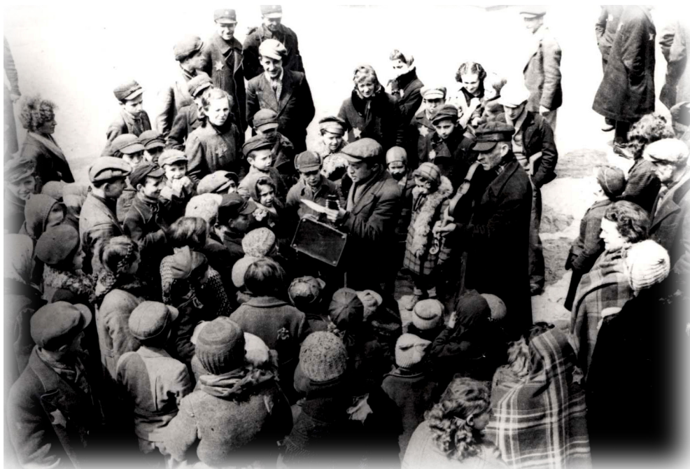
זמר רחוב | גטו לודז', 1934

שיר זה של מרדכי שטריגלר חובר בפעילות חינוכית מחתרתית במחנה הריכוז בוכנוולד, וסותר את ההוויה ואת המציאות שסבבו את אסירי המחנה. מול האמת האחת של הנאציזם מוצגת אמת ערכית אחרת. בצד היות השיר קריאת תיגר על המציאות, הוא גם מהווה עוגן לעולם נורמטיבי בתום המלחמה - התשתיות של מוסר, צדק ושוויון, גם במחנת, אכן קיימות ויוכלו להוות מסד לעולם המתוקן שיוקם. מעבר לתוכן המסוים של כל שיר, שירים ערכיים אלו ואחרים שנכתבו בשואה מבטאים את העובדה שמשמעות מסוג זה נותנת כוח וסיבה להמשיך ולהיאבק על החיים. מהאופי הקולקטיבי המובהק של השירים בשילוב מסרי העידוד משתמעת התעצמות הזחות.