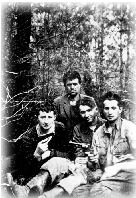
קבוצת פרטיזנים יהודים יערות בראנסק, 1942

אחד השירים שהושרו בתקופת השואה והיה גם להמנון היה שיר הפרטיזנים: