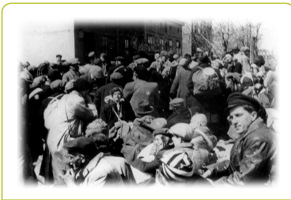
גירוש יהודים מגטו לודז', 1942

גטו לודז' חוסל באביב 1944 ורוב תושבי הגטו נשלחו להשמדה באושוויץ.