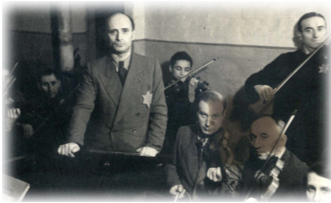
תזמורת גטו קובנה

קובנה נמצאת בליטא, אך בתקופה שבין שתי מלחמות העולם (1917-1939) היא הייתה חלק מפולין. בפרוץ המלחמה סופחה קובנה לברית המועצות. בקיץ 1941 כבשו אותה הנאצים. באוגוסט 1941 נכלאו בגטו יהודי קובנה כ־29,760 איש. באוקטובר 1941 החלו סדרות של רציחות שבמהלכן נרצחו כ־12,000 יהודים בפאתי העיר, כמחציתם ילדים. בגטו הוקמה "מועצת הזקנים של קהילת הגטו היהודי בקובנה" שהייתה אחראית על חיי הגטו בכלל, ועל הפעילויות החינוכיות והתרבותיות בפרט. בגטו הוקמו מוסדות סעד, בית־חולים, בית־ספר, תזמורת ועוד. פעילויות התרבות והדת היו אסורות, אך על־פי המסורת של יהודי קובנה המשיכו גם בגטו בלימוד תורה, בפעילות חינוכית ובמתן עזרה הדדית. גטו קובנה חוסל סופית ביולי 1944, כאשר הצבא האדום (צבא ברית המועצות) התקרב לעיר.