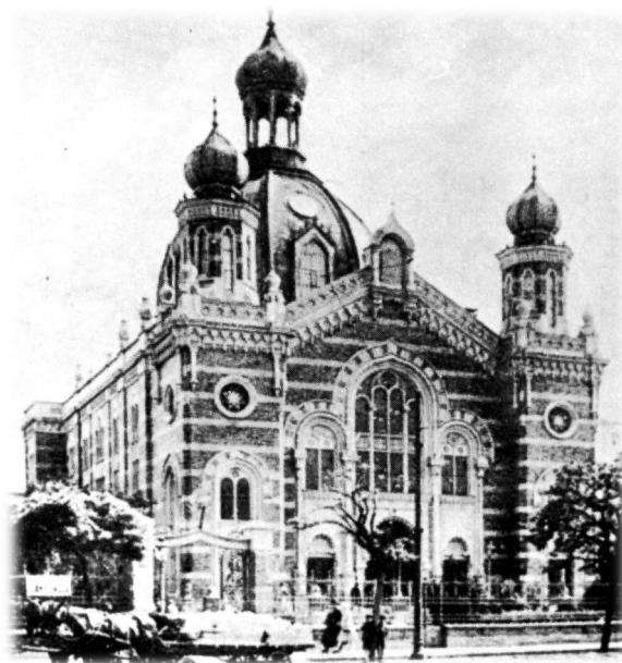
מראה בית הכנסת בדברצין, הונגריה

ב־19 במאָרס 1944 כבשו הנאצים את הונגריה שבה חיו כ־725,000 יהודים. הונגריה הייתה המדינה האחרונה שנכבשה על־ידי הנאצים, שנה לפני סיום המלחמה. מיד עם הכיבוש הוכרחו יהודי הונגריה לתפור על בגדם את הטלאי הצהוב, בתי עסק יהודיים נסגרו, ילדים יהודים הוצאו מבתי־ספר ועוד. בבודפשט, בירת הונגריה, הוקם גטו ואליו נדחקו יהודי העיר שעדיין לא נשלחו למחנה ההשמדה אושוויץ בפולין. מהערים הקטנות יותר ברחבי הונגריה שולחו להשמדה, תוך חודשיים, ממאי עד יולי 1944, כ־434,350 יהודים הונגרים. חלק מהיהודים נשלחו למחנות ריכוז ומחנות מעבר, ביניהם העד משה פורת שהיה אסיר במחנה מעבר דברצין, מעין גטו שבו ריכזו את יהודי הסביבה.