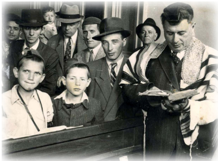
חזן וילדים בטקס בר מצווה בבית יתומים, בוקרשט, רומניה, 1944

היינו בדירה חודשים אחדים והגעתי לגיל שלוש עשרה. לא היו לי שום ציפיות לחוגג בר־מצווה. לכן הופתעתי כל כך כשאבא הביא לי – מי יודע מהיכן? זוג תפילין. בשבת בבוקר הלכנו כל בני המשפחה לבית הכנסת, ואני עליתי לתורה. עם סיום התפילה עזבו המתפללים במהירות את בית הכנסת, ולמרות מצב החירום קיבלתי לא פחות משישים וחמש מתנות!"