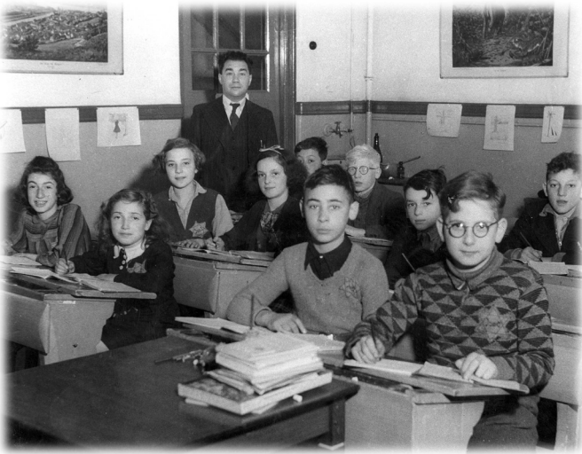
ילדים בבית ספר יהודי באמסטרדם, הולנד, בזמן הכיבוש הנאצי

נולדה בגרמניה, ולאחר ליל הבדולח, ב־1938, ברחו עם משפחתה להולנד. שם נאסרו היא ומשפחתה במחנה אוסטרבורק. משם נשלחו לברגן בלזן. מברגן בלזן נשלחו דרך תורכיה לישראל בהסכם חילופי שבויים ייחודי מאוד וחד פעמי שבמסגרתו הוחלפו יהודים בגרמנים שישבו בארץ ישראל (הטמפלרים).